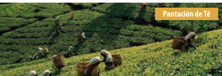
Pantación de Té

De no reunirse un grupo de 16 personas, el suplemento por grupo de 10 a 15 personas sería 165,00 €.